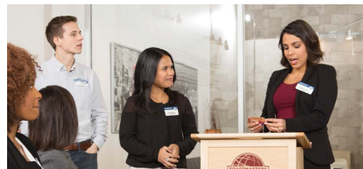
Table Topics (Stegreifreden). Während der Table Topics haben alle Teilnehmer die Gelegenheit, ein bis zwei Minuten lange, improvisierte Reden zu halten. Dies ist häufig der herausforderndste und unterhaltsamste Teil Ihres Clubtreffens.

Die Reihenfolge und die Länge dieser Segmente kann von Club zu Club unterschiedlich sein. Die Länge eines Clubtreffens bestimmt häufig die Zeitdauer für jedes Segment.